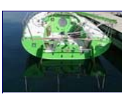
Der erste österreichische Minitransat-Racer "GUIZMO"